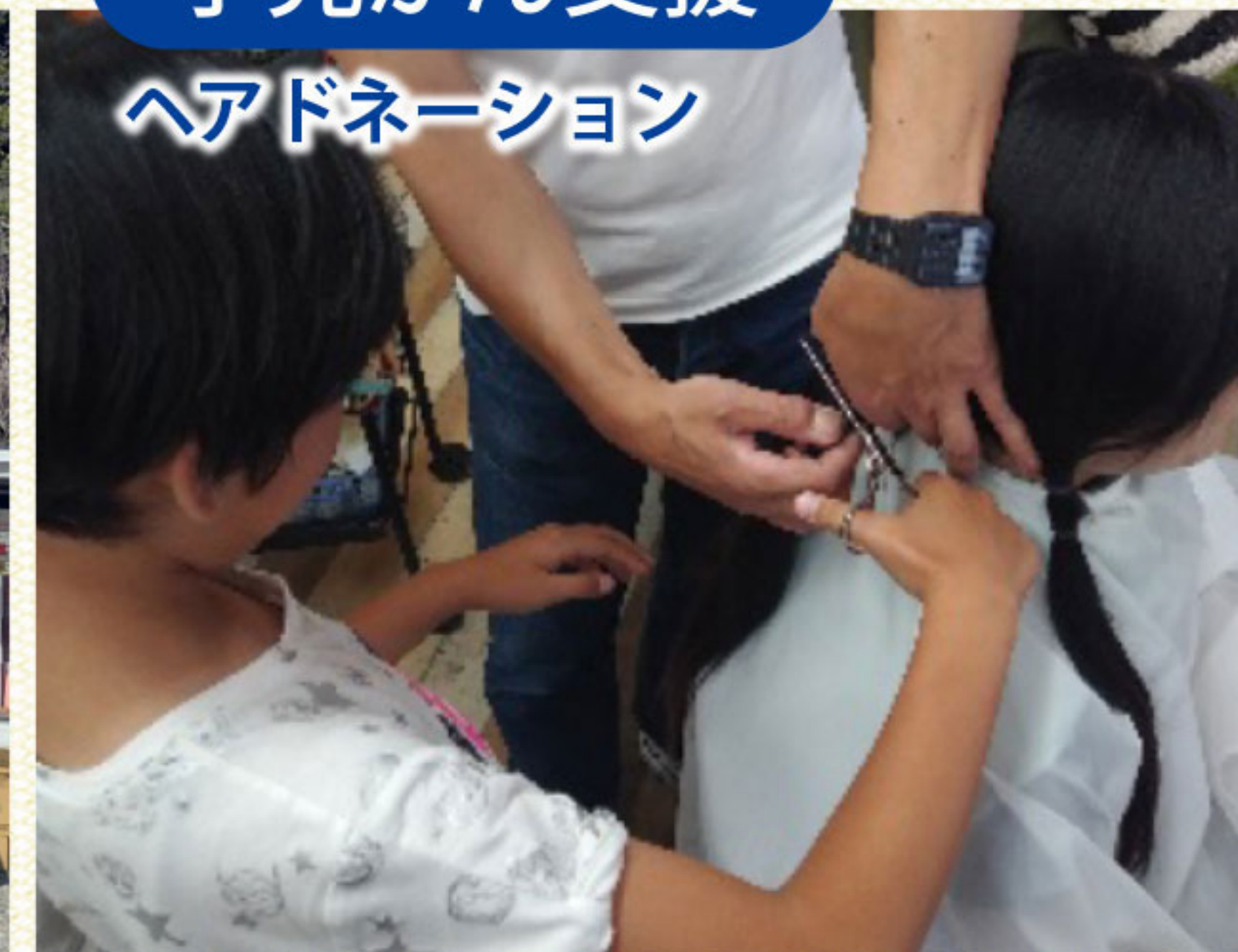
ヘアドネーション