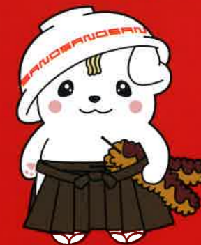
佐野ブランドキャラクター さのまる © 佐野市

2023年4月22日(土) 前夜祭 道の駅どもんなかたぬま 2023年4月23日(日) 年次大会 佐野市文化会館