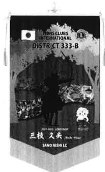
〔キャビネットバナー〕